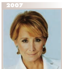
Excm. Sra. Dña. Esperanza Aguirre Gil de Biedma Presidenta de la Comunidad de Madrid