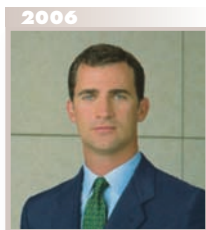
S.A.R. El Príncipe de Asturias, D. Felipe de Borbón y Grecia