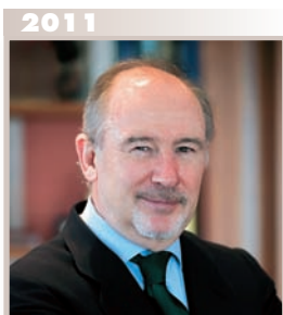
Excmo. Sr. D. Rodrigo de Rato y Figaredo Presidente de Bankia