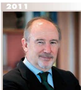
Excmo. Sr. D. Rodrigo de Rato y Figaredo Presidente de Bankia