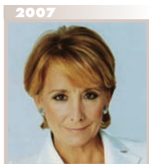
Excm. Sra. Dña. Esperanza Aguirre Gil de Biedma Presidenta de la Comunidad de Madrid