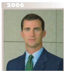
S.A.R. El Príncipe de Asturias, D. Felipe de Borbón y Grecia